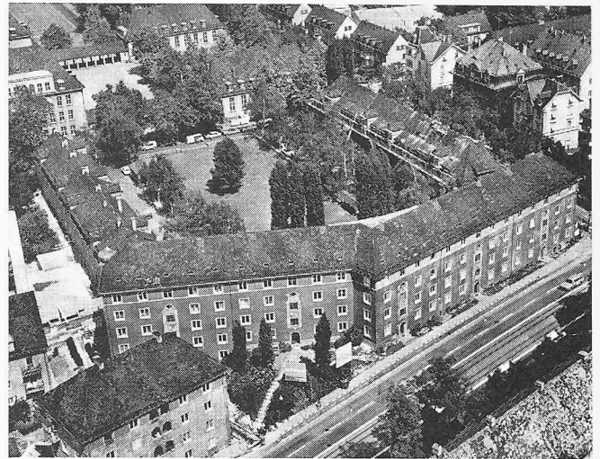
Die in Sanierung befindliche Wohnkolonie «Im Birkenhof» in Zürich Unterstrass (erbaut 1926, 101 Wohnungen)

«Der Ruf der Westtangente ist denkbar schlecht . Die Immissionen, die sie für die Anwohner bringt, übersteigen auf einzelnen Strecken das zumutbare Mass, und die städtebauliche ‚Wunde‘, die der Strassenzug vor allem in Wipkingen aufgerissen hat, ist noch nicht geheilt. Die Aufgaben, die sich hier stellen, sind gewiss nicht unlösbar, aber noch neu; teils mangelt es an den gesetzlichen Grundlagen, und vor allem fehlt – Behörden und Anwohnern – noch die Erfahrung. Immerhin sind nun Messungen und Versuche mit Doppelverglasungen im Gange; noch weniger scheint leider die Möglichkeit von Zweckänderungen besonders stark betroffener Häuser und Umsiedlungen untersucht zu werden. Eine wirksame und zielstrebige Politik auf diesem Gebiet ist dringend nötig.»