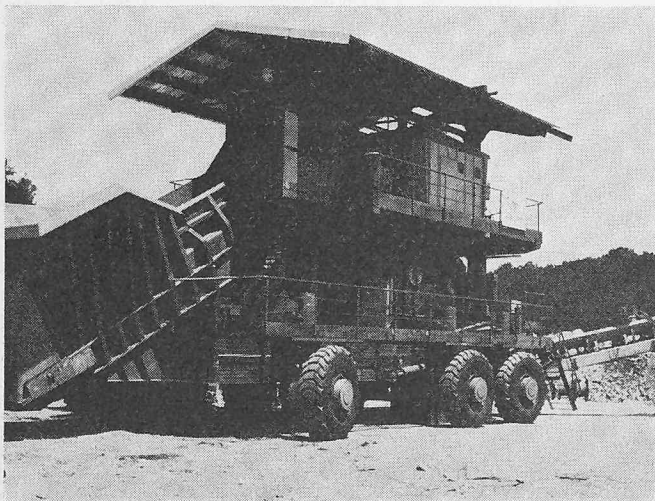
Mobile Brechanlage für Brechleistungen bis zu 600 t/h

hat. Der Antrieb erfolgt über Hydraulikmotoren in den Radnaben und Planetengetriebe. Die Fahrgeschwindigkeit beträgt 700 m/h. Ausser für Kurvenfahrt lassen sich die einzelnen lenkbaren Räder auch für Schräglauf um 15° einstellen. Die gesamte Anlage hat eine installierte Leistung von 700 kW.