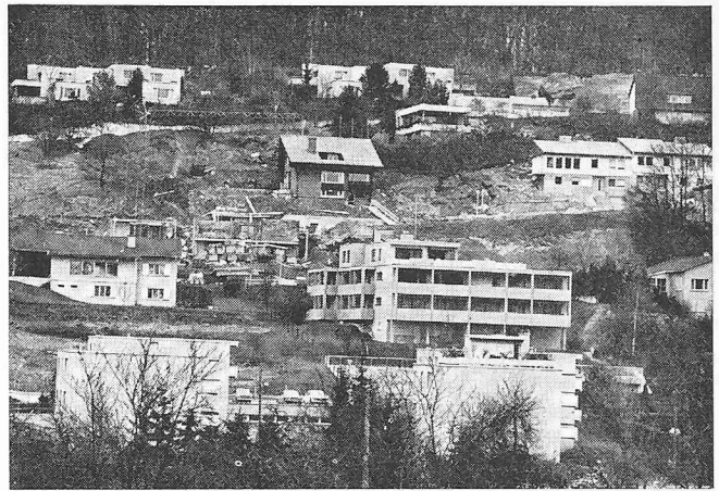
«Auf den ‚Einfamilienweiden‘ (Alexander Mitscherlich) führt die Devise ‚allen alle Freiheit‘ für die Realisierung ihrer baulichen Träume ebenfalls zum Chaos. Das erträumte individuelle Gesicht wird egoistische Fratze» (Birmensdorf ZH, Bild 62)

Wenn ein Mensch in so hohem Masse unordentlich daherkommt, wie unsere bauliche Umwelt heute, so zögern wir nicht, auf eine Zerrüttung des Charakters dieses Men-