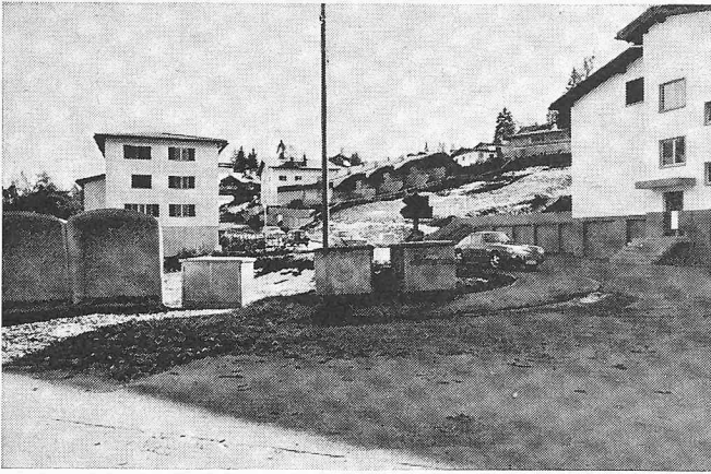
«Chaotische Zerstörung von Erholungslandschaften (Abfallcontainer als Denkmäler der Wegwerfgesellschaft). Eines Tages wird der Vogelzug der Touristen diese Plätze verlassen und neue, schönere, unverdorbenere Gebiete anfliegen – und die traurige Geschichte beginnt wieder von vorne» (Flims-Waldhaus, Bild 184)

intensiveren Bemühungen. In Teilbereichen sind zwar Erfolge zu verzeichnen. Bauzonen werden von Freihaltegebieten abgetrennt. Genügt das? Ist die Planung imstande, das Geschehen innerhalb der Bauzonen wirksam zu beeinflussen? Sie müsste das eigentlich können, damit eben nicht das herauskommt, was uns Rolf Keller vor Augen hält. Allzuerne richten wir unser Augenmerk nur auf die guten Einzelbauten oder Baugruppen, die da und dort, sogar in grosser Zahl, auf Initiative einzelner Bauherren, Architekten, Ingenieure, Behörden entstehen, meist neben oder sogar gegen bestehende Bauvorschriften und Planungen. Vermögen sie den Gesamteindruck zu verbessern? Was ist zu tun, was ist bis heute getan worden, um eine grundsätzliche und umfassende Verbesserung herbeizuführen?