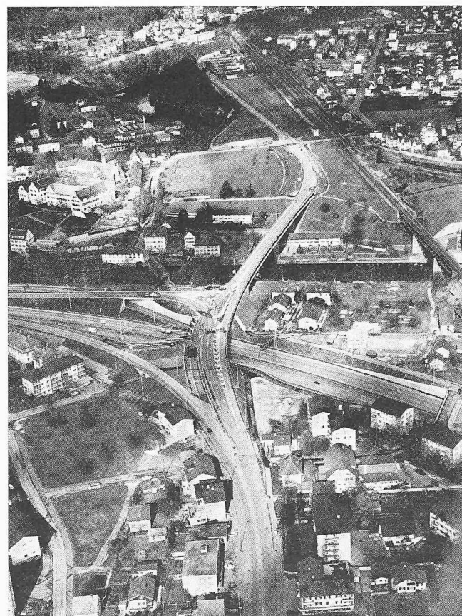
«Der Anfang zur Totalzerstörung ganzer Landstriche ist gemacht!» (Neuenhof AG, Bild 109)