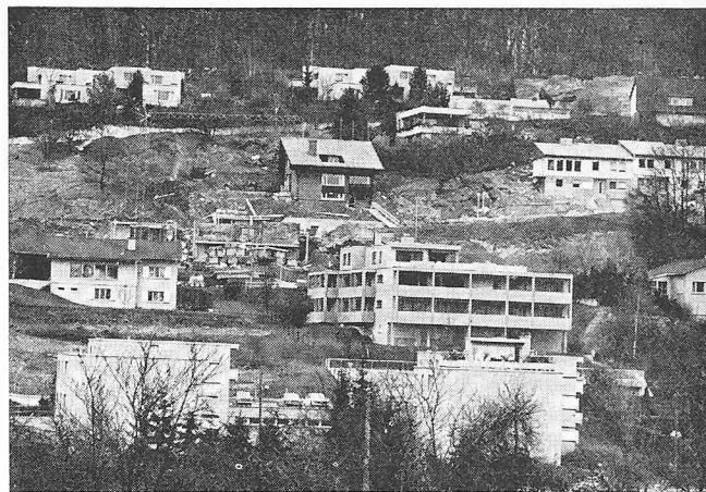
«Auf den ‚Einfamilienweiden‘ (Alexander Mitscherlich) führt die Devise ‚allen alle Freiheit‘ für die Realisierung ihrer baulichen Träume ebenfalls zum Chaos. Das erträumte individuelle Gesicht wird egoistische Fratze» (Birmensdorf ZH, Bild 62)

Wenn ein Mensch in so hohem Masse unordentlich daherkommt, wie unsere bauliche Umwelt heute, so zögern wir nicht, auf eine Zerrüttung des Charakters dieses Men-