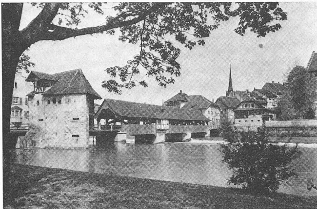
Brücke von Bremgarten über die Reuss mit Stadtbild

einfachen Betonbalken vorgenommen. Der Aufbau der Brücke in Holz wurde der alten Konstruktion angepasst. Sie ist aber lediglich eine Attrappe und hat keine tragende Aufgabe mehr. Hier hat das aargauische Tiefbauamt richtig erkannt, dass die Holzbrücke Teil des Bremgartner Stadtbildes ist und bleiben muss.