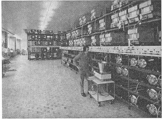
Aromenausmischung (Manipulation). Für mittlere Mengen werden die Rohstoffe aus Bidons mittels Stickstoff direkt auf fahrbare Waagen gedrückt

Die interne Erschliessungsstrasse ist mit zwei Halbgeschossen unterkellert. Das obere Halbgeschoss dient als Installationsgeschoss zur horizontalen Verteilung der Leitung. Die vertikale Verteilung erfolgt fassadenseitig im Bereich der Treppenhaus-Lift-Türme. Im unteren Halbgeschoss befinden sich Nebenräume für Installations-Unterstationen und Betriebspersonal.