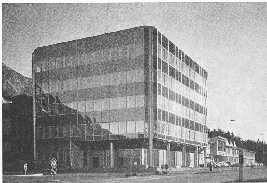
Verwaltungsgebäude der Hilti AG, Schaan FL, mit zurückgesetzter Eingangspartie. Architekten: Burckhardt & Partner, Basel