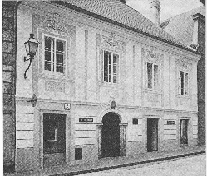
Das Haus Schmidgasse 3 nach der Revitalisation