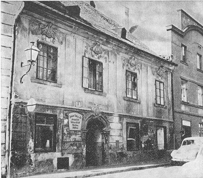
Krems a. d. Donau: Das Haus Schmidgasse Nr. 3 vor der Restaurierung