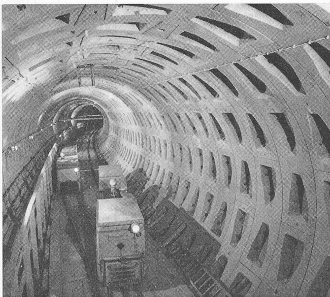
Bild 1 (links). Streckentunnel von Bild 2 im Bauzustand. Einschaliger Tunnelausbau mit Stahlbetontübbings

Die erste Ausführung im Verkehrstunnelbau findet in München im Baulos 7.1 der U-Bahnlinie 8 statt (1,2), das sich vom Startschacht in der Schlotthauerstrasse am südlichen Isarufer bis zum Sendlinger Tor in Zentrumsnähe erstreckt und zwei eingleisige, rd. 1320 m und 990 m lange Tunnelröhren von 6900 mm Aussendurchmesser (Bild 2) mit dem Bahnhofbauwerk Frauenhoferstrasse – zwischen den Haltestellen Kolumbusplatz und Sendlinger Tor – umfasst. Die Tunnelröhre liegt etwa 15 m unter dem Wasserspiegel der Isar und wurde im wesentlichen Abschnitt von