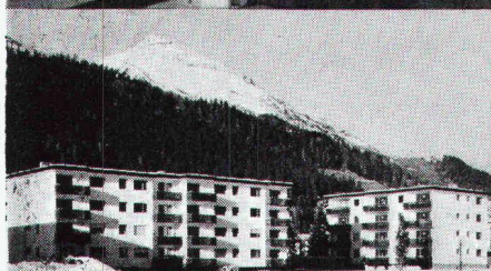
Überbauung Rietstrasse, Elektrizitätswerk der Landschaft Davos; total 33 Wohnungen; Anschlusswert ca. 400 kW

Star Unity AG Fabrik elektrischer Apparate Zürich, in Au/ZH Tel. 01 75 04 04