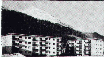
Überbauung Rietstrasse, Elektrizitätswerk der Landschaft Davos; total 33 Wohnungen; Anschlusswert ca. 400 kW