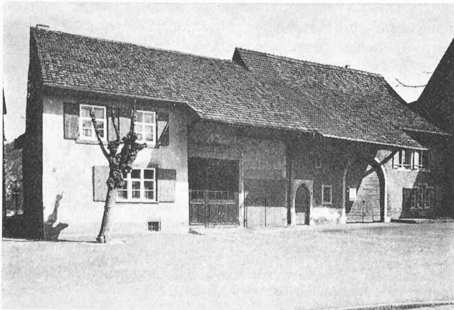
Bild 4. Die zwei alten Bauernhäuser – der ursprünglichen Funktion beraubt und so dem Zerfall preisgegeben – konnten durch die bauliche Sanierung wieder eine neuzeitliche Aufgabe übernehmen

Den ersten Schritt zur Aktivierung des Dorfkerns bildete der Entschluss, ein Gemeindezentrum in unmittelbarer Nachbarschaft der befestigten Burgkirche St. Arbogast aus dem 12. Jahrhundert zu errichten. Das neuzeitliche Bauprogramm mit Gemeindeverwaltung, Hotel, Saal und Läden wurde im