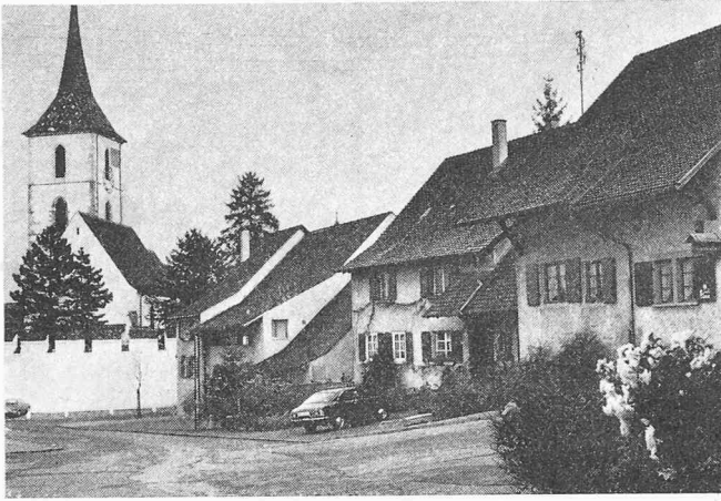
Bild 6. Viele Bauernhäuser sind bereits umgebaut und renoviert und geben so den Strassenzügen, die sternförmig bei der Ringmauer der kürzlich restaurierten Kirche St. Arbogast enden, wieder eine belebte und wohnliche Note. Der Dorfkern von Muttenz ist endgültig gerettet

nation und Ausstrahlung und wurde beispielhafter Gradmesser für weitere Renovationen.