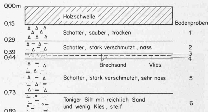
Bild 1. Schlitzprofil, zweifach überholt

Im Jahre 1975 wurde unter einer Weiche eines Betriebsgleises ein Vlies mit einem Eigengewicht von 340 Gramm je Quadratmeter und 2,8 Millimeter Dicke, eingebettet in eine dünne Schutzschicht aus Brechsand als Filter sowie ein neues Schotterbett eingebaut. Die Belastung des Gleises beträgt rund 27 000 Bruttotonnen je Tag. Im September 1977 wurde eine Schwelle entfernt, zwischen den benachbarten Schwellen ein Schlitz ausgehoben und geotechnisch aufgenommen. Aus jeder Schicht wurde eine Bodenprobe entnommen und im Erdbaulabor klassifiziert. Das Bodenprofil ist in Bild 1 dargestellt. Es zeigt, dass die untersten 10 Zentimeter, d.h. rund 40% der zwischen