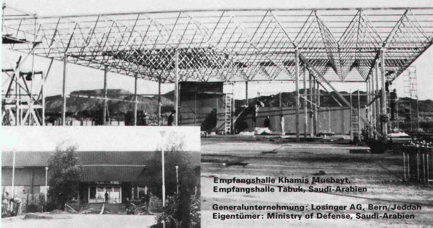
Empfangshalle Khamis Mushayt, Empfangshalle Tabuk, Saudi-Arabien

Monbijoustrasse 16 Telex 33260 mapa ch, Tel. 031 25 43 55/56