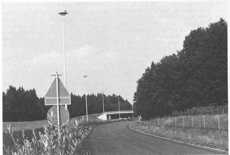
Bild 3. Beleuchtung entlang der Autobahn, Lichtpunkthöhe 15 m, Lichtpunktabstand 60 m

Die Kosten für die Beleuchtungssteuerung und die Erfassung der dazu nöti-