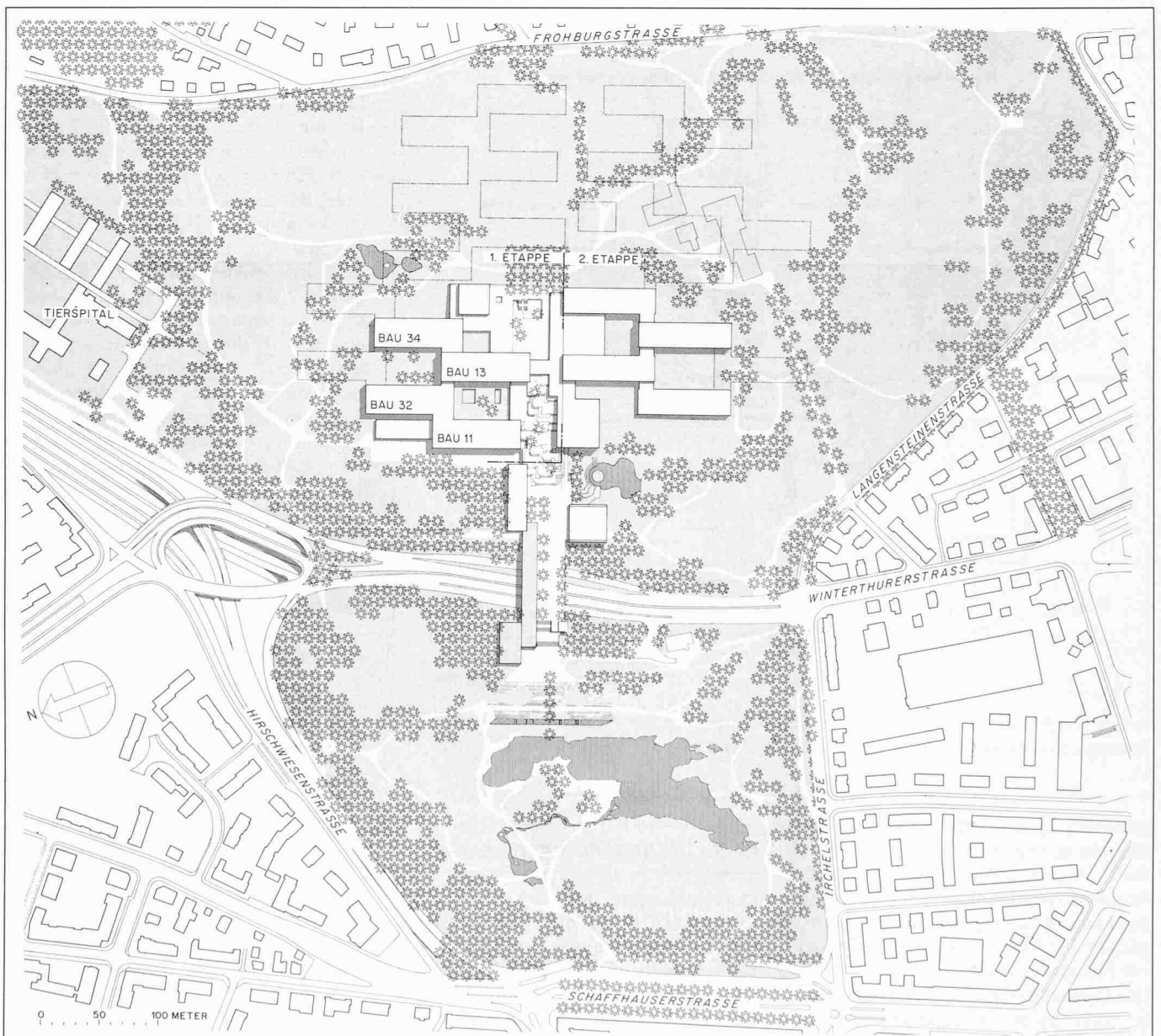
Lageplan der Gesamtanlage. Die Erweiterungsmöglichkeiten sind angedeutet. Die weiträumige Parkanlage dient nicht nur der Hochschule. Sie bildet auch ein attraktives Naherholungsgebiet für das Quartier