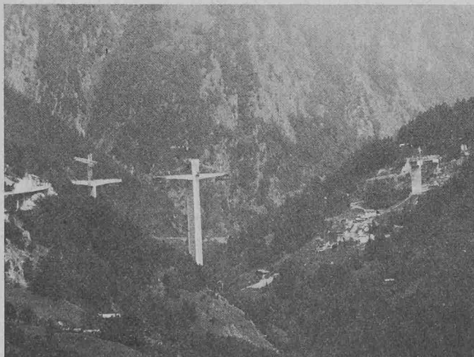
Auf einer Länge von 678 m wird die Ganterbrücke das Gantertal überqueren. In der Bildmitte der mit 148 m höchste Pfeiler 3. Noch nicht sichtbar ist rechts davon Pfeiler 4, der in den geologisch heiklen, linksufrigen Kriechhang zu sehen kommt und deshalb auf einem ca. 40 m tiefen Schacht fundiert wird

Turm des Wolffkrans mit dem kraneigenen, anbaubaren Kletterwerk freistehend bis 46,5 m Hakenhöhe verlängert. Auf 34,95 m Höhe brachte man die erste Kranverankerung am Pfeiler an, wobei die Ankerplat-