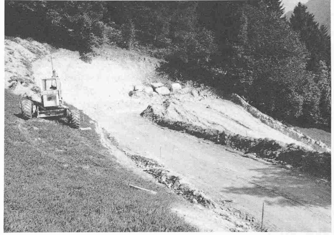
Bild 4. Ausbau der Strasse nach Ruen nach Panix. Ausweitung einer Wendeschleife oberhalb Ruen. Bauzustand: 11. Sept. 1979

Realisierung von Wasserkraftanlagen acht bis zehn Jahre benötigt.