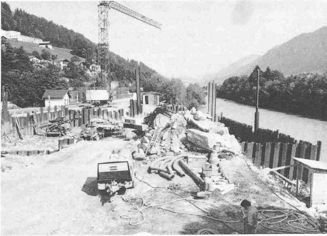
Bild 3. Baustelle Auslauf der Unterwasserkanäle zwischen Kantonsstrasse (links) und Vorderrhein. Baubeginn: 21. Mai 1979. Bauzustand: 11. Sept. 1979