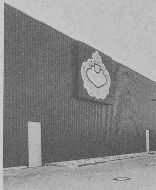
Thyssen-Thermowand. Typ VT 66 ( k = 0,559 W/m 2 K)

Die Wärmeleitfähigkeit des diffusionsdicht eingeschlossenen Pur-Hartschaumes beträgt 0,029 W/mK (0,025 kcal) und ergibt dabei Wärmedurchgangszahlen von k = 0,795 W/mK (0,684 kcal) bei 37 mm Wandstärke bis zu k = 0,161 W/mK (0,138 kcal) bei 180 mm Dicke. Dichte Elementstöße und der