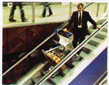
Bild 1. Rolltreppengängiger Gepäckrolli

Für die Aufbewahrung des Gepäcks sind in der Bahnhofshalle 200 Selbstbedienungs-Schliessfächer vorhanden. Die sperrigen Stücke lassen sich auf