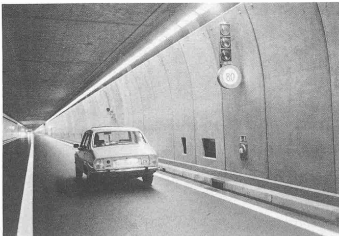
Bild 2. Beleuchtung der Mittelzone

Obwohl der Gotthard-Strassentunnel mit einer äusserst zuverlässigen Energieversorgung ausgestattet ist, muss mit zeitweiligen Spannungsunterbrüchen gerechnet werden. Sie können sowohl den ganzen Tunnel umfassen, als auch partiell , infolge eines Defektes in der tunnelinternen Verteilung, auftreten. Diese Unterbrüche bewirken einen Ausfall der Tunnelbeleuchtung und damit verbunden eine plötzliche Reduktion der Sichtweite. Bei einem Fahrzeuglenker kann dies zu Fehlreaktionen und als Folge davon zu einem Unfall führen. Nebst Fahrzeugen, die wenigstens mit einer eigenen Beleuchtung ausgestattet sind, die bei der Durchfahrt eingeschaltet ist, muss im Tunnel mit Fussgängern ( Pannenfahrzeuge ) gerechnet werden. Um diese Gefahrenquellen auszuschalten, ist der Tunnel mit einer Notbeleuchtung versehen. Sie ist in die Normalbeleuchtung integriert, so dass keine speziellen Notleuchten installiert werden mussten. Jede zehnte Leuchte der Fluoreszenzbeleuchtung wird dauernd von einem Wechselrichter gespeist. Bei vorhandenem Netz erhält der Wechselrich-