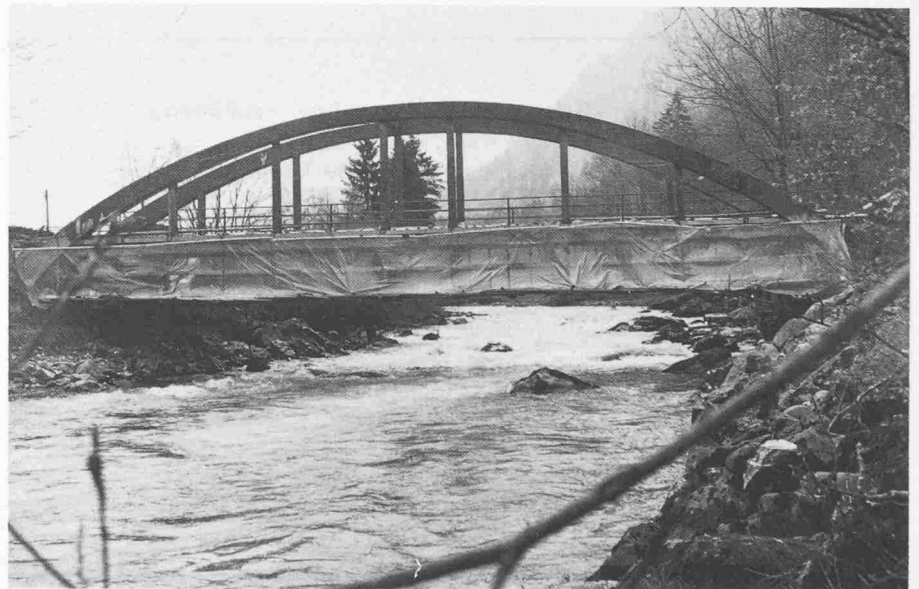
Bild 1. Gizenenbrücke mit untergehängtem Arbeitsgerüst

Spannungsnachweise mussten anhand der heutigen Verhältnisse neu erstellt werden. Die Resultate der Berechnung zeigen, dass sowohl die Bogenträger als auch die Fahrbahnaufhängungen den geforderten Belastungsannahmen der genannten Norm genügen. Die Fahrbahnträger wurden damals, wie aus der vorhandenen Armierung ersichtlich, durch nicht zutreffende Verhaltensannahmen des Systems, starrer Bogen und starre Aufhängungen, als Durchlaufträger berechnet. In Wirklichkeit bewirkt