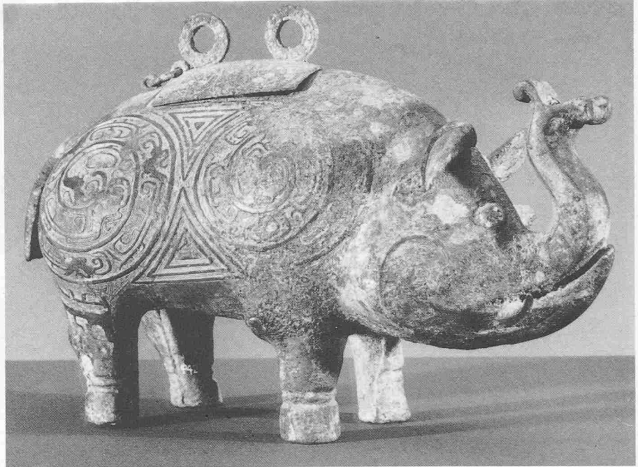
Zun in Gestalt eines Elefanten, westliche Zhou-Dynastie, 10. Jahrhundert v. Chr., Bronze