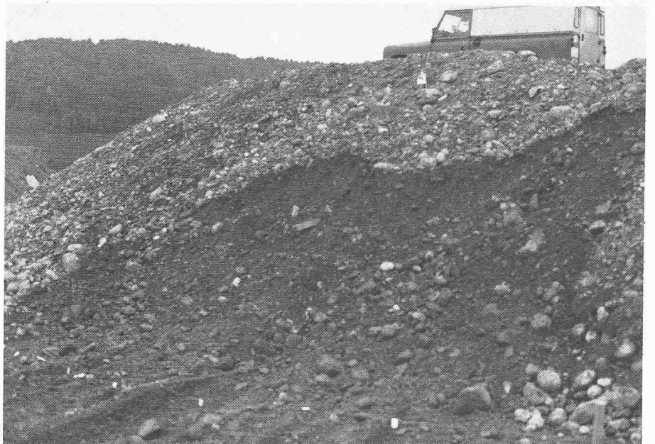
Bild 5. Hang nach der zweiten Hangfussentlastung