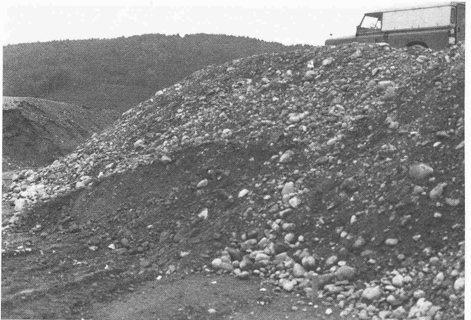
Bild 4. Hang nach Entnahme der ersten zwei Trax-Schaufeln