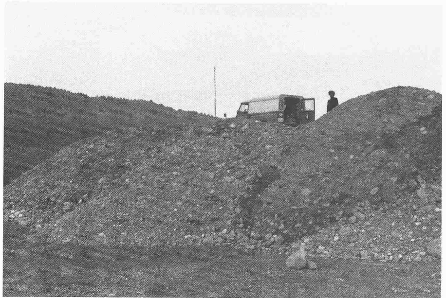
Bild 3. Hang vor dem Eingriff