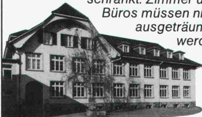
Schulhaus in Bremgarten, BE. Altbau renoviert mit Holz-Wechselrahmen-Fenstern und Isolierverglasung.

Einsatzort auf ein Minimum beschränkt. Zimmer und Büros müssen nicht ausgeträumt werden