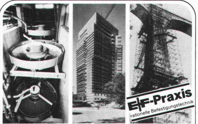
Schwerstbefestigungen Fassadenverkleidungen Betonverbindungen

EF-Praxis rationelle Befestigungstechnik