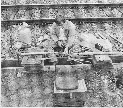
Bild 10. Kabelmonteur bei der Spleissarbeit