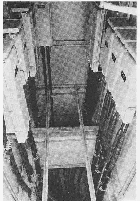
Bild 9. Kabelstützpunkt für Umschaltmöglichkeit im Störfall