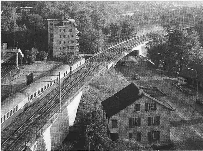
Bild 1. Überführung Aarburgerstrasse und Kessilochbrücke. Der TEE «Rheingold» zweigt auf die neue Linie nach Genf ab. Im Hintergrund befährt der InterCity «Tiziano» die alte, bestehende Linie nach Luzern