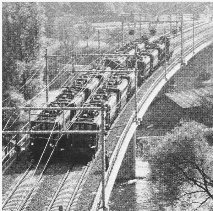
Bild 4. Bremsversuch mit 16 Lokomotiven