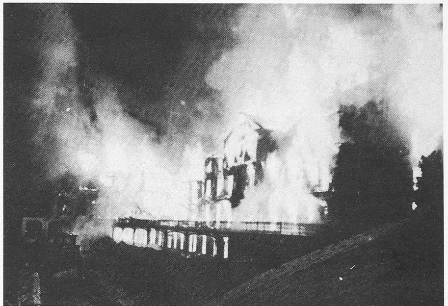
Brand des Grand Hotel Rigi-Kaltbad (9. Febr. 1961)

Der Feuerpolizei kommt heute eine relativ grosse Bedeutung zu; sie ist ein Spezialgebiet . Organisatorisch ist sie in den meisten Kantonen von der Baupolizei getrennt und auf kantonaler und auf Gemeinde-Ebene einer besonderen Behörde zugewiesen. Die Kompetenzaufteilung zwischen Kanton und Gemeinden ist in der Regel der Organisation im kantonalen Baurecht nachgebildet. In den Kantonen, in denen eine kantonale Gebäudeversicherung existiert, nimmt sie oder eine gleichgestellte Abteilung die feuerpolizeilichen Aufgaben auf kantonaler Ebene wahr. In den übrigen Kantonen ist die Feuerpolizei stärker dezentralisiert; die kantonale Aufsicht ist vorwiegend Koordinationsstelle.