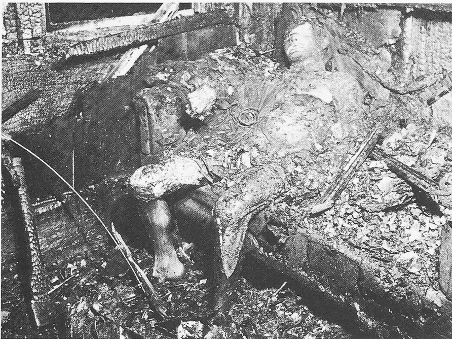
Personenschutz durch Brandschutz rettet Menschenleben!

VKF wahr, indem sie technische Richtlinien ausarbeitet. Sie sind als «Wegleitungen für Feuerpolizei-Vorschriften» publiziert.