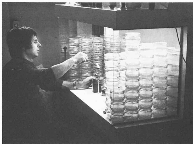
In einer «Impfkammer» werden kleine Pflanzen oder Sprosssteile, die in Gläsern auf Nährmedien gezüchtet werden, mit Agrobakterien infiziert. Anders als im Gewächshaus wird hier unter sterilen, kontrollierten Bedingungen gearbeitet und ein Befall der Versuchspflanzen durch andere Mikroorganismen verhindert

Das zweite Ziel ergibt sich aus der Tatsache, dass Pflanzen ihre Speicherproteine zunächst für ihren eigenen Gebrauch bilden, und das deshalb die Zusammensetzung dieser Proteine nicht immer ideal für die menschliche Ernährung ist. So enthalten beispielsweise Mais-Proteine zu wenig Lysin und Methionin, beides sogenannte essentielle Aminosäuren, die der Mensch nicht selbst synthetisieren kann und deshalb mit der Nahrung aufnehmen muss: Ist er, wie etwa in südamerikanischen Ländern, auf Mais als Hauptnahrungsmittel angewiesen, dann drohen ihm Mangelkrankheiten.