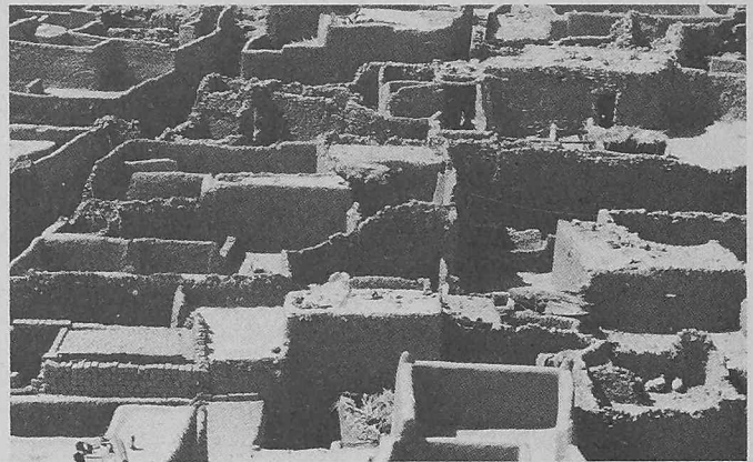
Ighzer, Dachlandschaft einer kompakten Siedlungsanlage

tektek Hans Imesch und Hans-Ulrich Thomann durchgeführten planerischen Analyse «Timimoun, Habitat-Rural unter den Bedingungen eines trocken-heissen Wüstengebietes». Es ging darum, typische Siedlungsformen im bestehenden Zustand zu