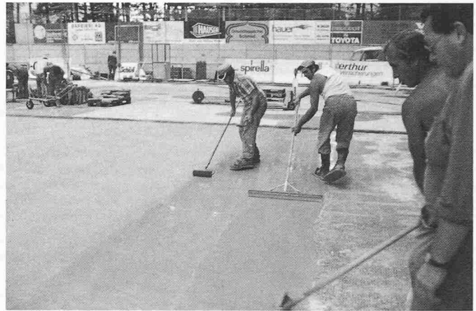
Bild 3. Giessmörtel (1,2 mm) wird mit gezahnter Gummirakel aufgetragen und verteilt. Eingeschlossene Luft wird mit einer Stachelwalze ausgetrieben und die Oberfläche ausgegallert. Im Hintergrund Teil der Mischstation: Mörtelaufbereitung mit Beba-Mischer

der relativ grosse Längsdehnungen rissfrei aufnimmt und die bautechnischen und betrieblichen Anforderungen erfüllt.