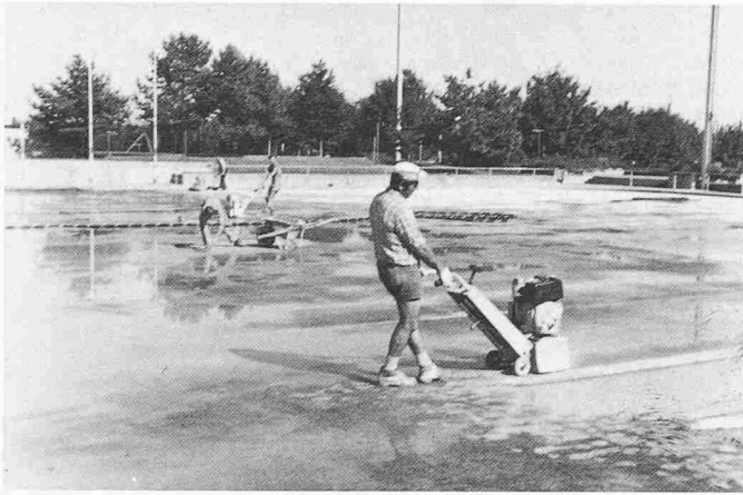
Bild 2. Untergrundbehandlung durch Überfräsen des Ortsbetons mit von-Arx-Aufrauherät. Ausgalisieren von ausgespitzten Stellen. Kontergefälle und Vertiefungen mit Giessmörtel aufgiessen, Quarzsand einstreuen