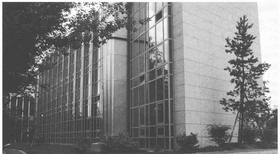
Bild 1. Neubau der Aarg. Kantonalbank in Wohlen. Südwest-Fassade aus Betonelementen. Nordwest-Fassade als Fensterfront der Büroräume mit der Möglichkeit zum Öffnen der Fenster

Die wichtigste Sparfunktion hat der «Wärmerückgewinner» (Wärmeaustauscher). Durch ihn strömen auf der einen Seite die kalte Aussenluft aus dem Freien, auf der anderen Seite die warme verbrauchte Fortluft aus dem Raum. Die verbrauchte Luft gibt im «Rückgewinner» Wärme an die kalte Aussenluft ab und erwärmt diese in bedeutendem Masse. Wärmerückgewinner haben Wärmeübertragungsgrade von 50-90%. Bei etwa 70% Übertragungsgrad erwärmt also z. B. die warme Fortluft die kalte Aussenluft von -10^{\circ}\text{C} auf +10^{\circ}\text{C} , so dass diese vom Lufterwärmer (mit Energieaufwand) nur noch von +10^{\circ}\text{C} auf +20^{\circ}\text{C} aufgeheizt werden muss. Gleichzeitig kühlt sich