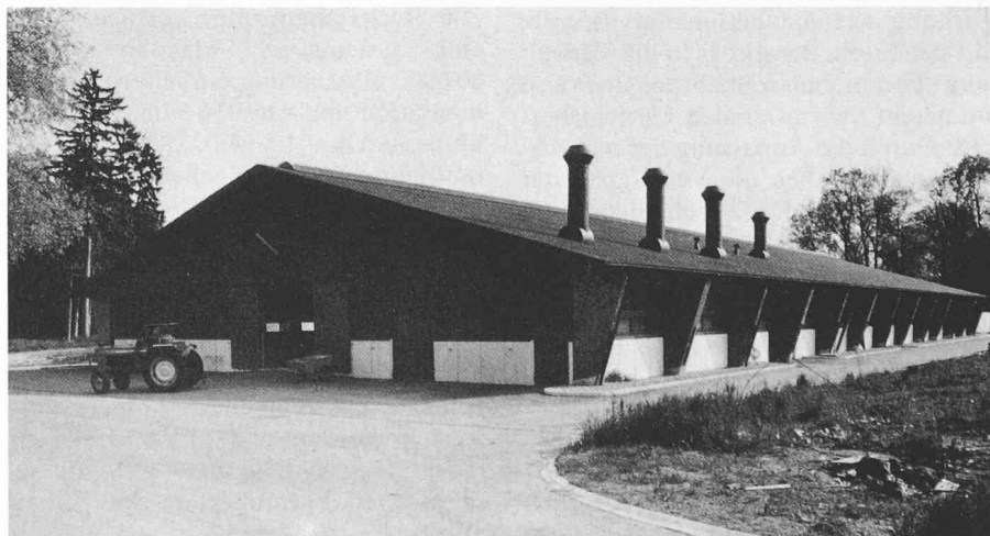
Bild 1. Strafanstalt Witzwil. Kuhstall des Gutsbetriebes

Alle Aussenwände bestehen aus vorgefertigten Betonelementen mit innenliegender Vormauerung. Zwischen diesem Zweischalenmauerwerk liegt die thermische Isolierung, bestehend aus 60 mm starkem extrudiertem Polystyrol-Hartschaum (Typ Styrofoam SM-TG der Dow Chemical Europe SA). Die gleiche thermische Isolation wurde auch unter dem Dach , einer Welleternitkonstruktion, eingebaut, jedoch in 80 mm Stärke. Die unteren Führungsplatten für die eintretende Kaltluft sind ebenfalls mit 40 mm starken