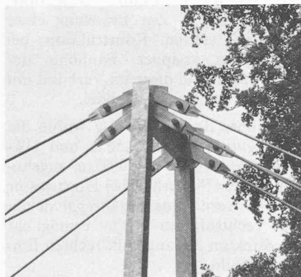
Bild 6. Pylonkopf mit Anschluss der Zugstangen

ebene konnte auf räumliche Anschlüsse verzichtet werden.