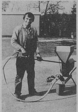
Mobile Pumpe Wangen 15.2 TR mit Zuführtrichter. Einsatz für Ankerpressmörtel

(VSE). Rund 45% der gesamten Inland-Stromproduktion im Dezember 1983 stammten aus den vier schweizerischen Kernkraftwerken (Beznau I & II, Mühleberg, Gösigen). Der Anteil lag deutlich über dem üblichen Wintermittel von 35%, weil die Produktion der Wasserkraftwerke infolge der Trockenheit weit unter den Durchschnitt sank. Gleichzeitig stieg der Elektrizitätsbedarf merklich und lag in verschiedenen Regionen um 6 bis 12% höher als im Vorjahres-Dezember. Dies führte zu einem beträchtlichen Versorgungsmanco, das im Rahmen des westeuropäischen Stromverbunds durch Importe gedeckt wurde. So ergab sich ein Importüberschuss von 513 Mio. kWh im Monat Dezember und von insgesamt 767 Mio. kWh für die beiden letzten Monate des Jahres 1983.