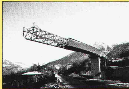
Einschubetappe einer Verbundbrücke