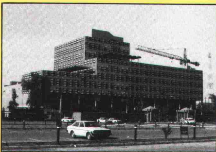
Immobilien Komplex in Baghdad (Irak)