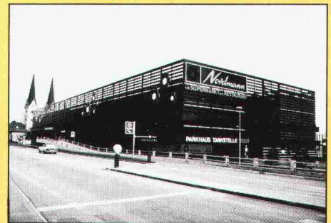
Mehrgeschossiges Parkhaus mit Zufahrt über Rampen

Als dynamisches, an der Spitze des technischen Fortschritts stehendes Metallbauunternehmen hat zwahlen & mayr sa eine Vielzahl bedeutender Projekte im In- und Ausland realisiert.