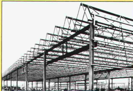
Metallstruktur eines Fabrikgebäudes mit Mini-Sheddach

zwahlen & mayr sa hat umfassende Erfahrung in anspruchsvollen Montagearbeiten auf der ganzen Welt.