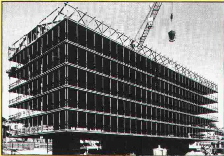
Stahlkonstruktion eines Verwaltungsgebäudes mit an den Dachträgern aufgehängten Zwischenböden