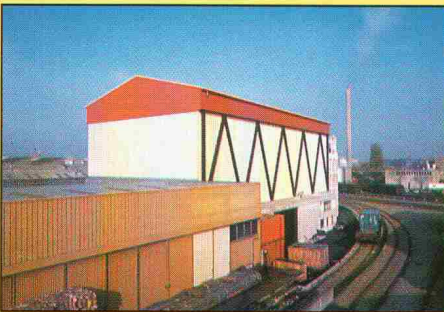
Dach, Decken, Fassaden, Tore, Türen, Fenster, Zwischenwände