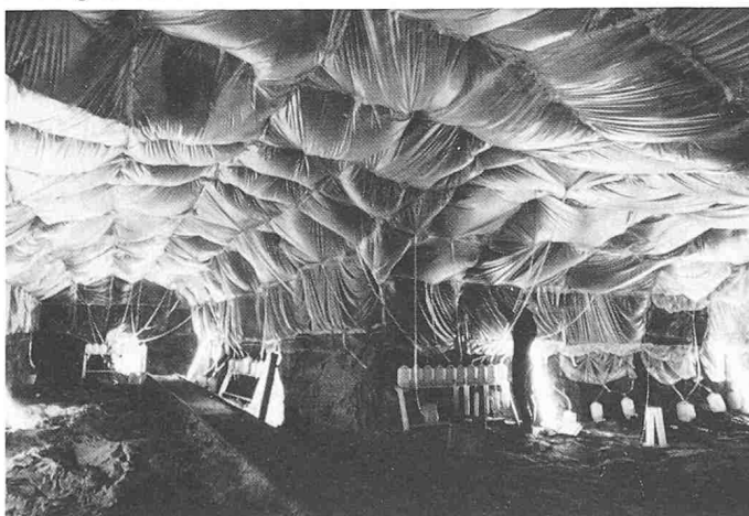
Bild 1. Kein Objekt des Verpackungskünstlers Christo, sondern eine Kunststoffverkleidung in einer Kaverne des internationalen Felslabors Stripa (Schweden), die verhindern soll, dass sich der Wasserhaushalt des Gesteins durch Verdunstung verändert