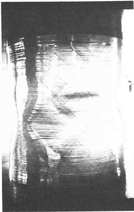
Beulen eines gewickelten Zylinders aus glasfaserverstärktem Kunststoff (GFK) unter axialer Druckbeanspruchung

sion zu erfassen und zu untersuchen. Dem Einfluss der Hydrodynamik, des Potentials wie auch der Zusammensetzung von Werkstoff und Angriffsmittel auf die Art und Häufigkeit des Lochbildungsvorganges wurde dabei besondere Beachtung geschenkt. Diese Untersuchungen erlauben nicht nur eine theoretische Deutung der Startvorgänge, sondern werden es auch ermöglichen, die für die Praxis wichtige Anfälligkeit auf Spaltkorrosion besser zu beurteilen.