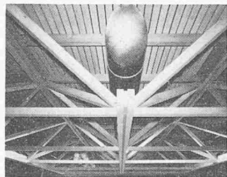
Raumtragwerk für Mehrzwecksaal

Mit dem Holzverbindingssystem BSB werden die zu verbindenden Holzstäbe und die Verbindungsmittel auf wenige genormte Typen reduziert. So verwendet man als eigentliche Verbindungsmittel nur Stahldübel mit gleichem Durchmesser und Knotenplatten gleicher Stärke. Diese Beschränkung erlaubt den Einsatz computergesteuerter Abbundanlagen. Am meisten vereinfacht wird beim BSB-System jedoch die Planung und Projektierung. Dies ist besonders für den Architekten und Ingenieur ein grosser Vorteil: Das BSB-System bietet viele Variationsmöglichkeiten, eignet sich besonders für sichtbare Konstruktionen, lässt die Verwen-