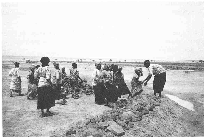
Fig. 3. Keita (Niger, 1985): murs anti-érosifs en construction