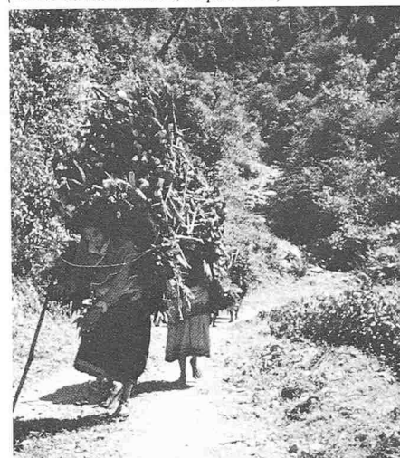
Fig. 5. Transport de «bois de feu» à dos de femmes sur plus de 25 km de distance (vallée de Kathmandu, Nepal, 1982)

Adresse de l'auteur: W.E. Pleines, Propr. Bureau Agriforest Ing.-conseils SA, 1038 Bercher.