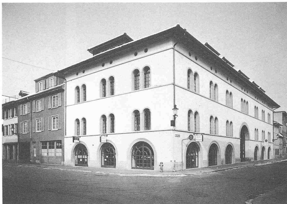
Emchpreis 1986: Umbau des Briner-Hauses in Winterthur