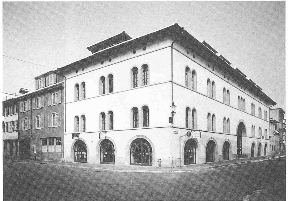
Emchpreis 1986: Umbau des Briner-Hauses in Winterthur