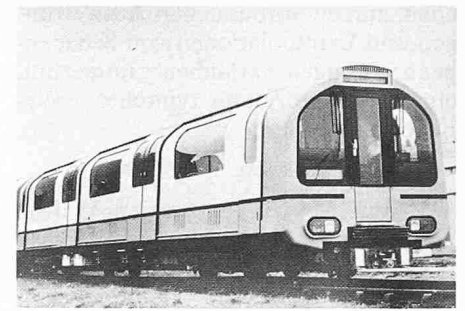
Prototypzug für die Central Line der Londoner U-Bahn. Brown Boveri hat diesen von Metro Cammell gebauten Zug mit modernsten GTO-Chopper-Antrieben ausgerüstet

- Allachsantrieb, wobei jede Achse durch einen fremderregten Fahrmotor Typ 4 EBO 1622, Baureihe «K», angetrieben wird. Der Motor mit einer BBC-Gummikupplung zwischen Motor und Getriebe (BBC-Leichtgetriebe Typ BGA 08.01) wird fest abgedeutet im Drehgestellrahmen eingebaut.