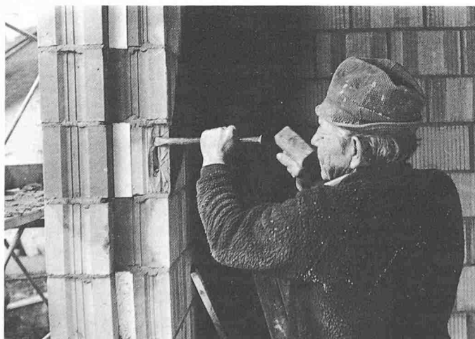
Bild 2. Vermessungstechnische Präzisionsinstrumente werden nicht benötigt. Hier ist die Ebenheits-Toleranz überschritten