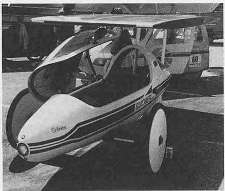
Bild 3. Solarmobil-Kabine-Dreiradroller

Der Erfolg der Tour de Sol 86 und die mühevolle Bewältigung der Bergetappen sollen uns aber nicht darüber hinwegtäuschen, dass Solarmobile noch unausgereifte Fahrzeuge sind. Immer noch ist die Tour de Sol der einzige Anlass, für den neue Solarmobile konstruiert werden. Die Tour de Sol wird auch 1987 weltweit kein entsprechendes Pendant haben. Deshalb findet die Weltmeisterschaft wiederum in der Schweiz statt. Im Moment laufen jedoch Verhandlungen mit dem Ziel, vorerst in Australien und Japan Veranstaltungen nach dem Tour de Sol-Modus durchzuführen, also Veranstaltungen, die zur Entwicklung von brauchbaren Serienscholarmobilen für den Nahverkehr führen.