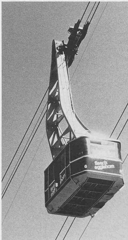
Touristische Transportanlagen prägen unsere Bergregionen massgeblich in vielen Belangen

ster Linie, frühzeitig auf Schwächen und Fehlentwicklungen aufmerksam zu machen, die dem Reiseland Schweiz in Zukunft zum Nachteil gereichen könnten. Die neueste Untersuchung