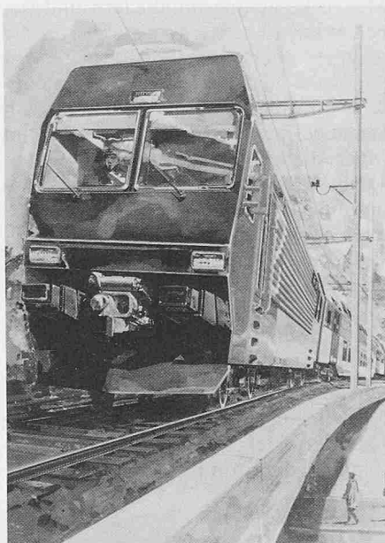
Die zukünftige, bereits in 24 Exemplaren bestellte Umrichter-Lokomotive für die Zürcher S-Bahn

(BBC) Für den Bau der Zürcher S-Bahn haben die Schweizerischen Bundesbahnen jetzt 24 Pendelzug-Lokomotiven Re 4/4 V bei der Schweizerischen Lokomotiv- und Maschinenfabrik, Winterthur (mechanischer Teil), und bei BBC Brown Boveri, Baden (elektrischer Teil), bestellt. Der Gesamtbedarf für die Zürcher S-Bahn liegt bei 70 Einheiten.