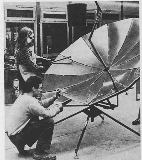
Schüler mit dem entwickelten Objekt, das zur Verbesserung der Infrastruktur im Gesundheitswesen von Entwicklungsländern beitragen soll. Der Parabolspiegel erzeugt auf einfache Weise Hitze zur Sterilisation von Instrumenten. Der Sterilisationsbehälter hängt im Brennpunkt der zentrierten Sonnenbestrahlung.

Das System sieht eine handwerkliche Fertigung für den Nachbau vor Ort vor. Die Materialkosten pro Sonnen-Sterilisator betragen rund 320 Franken und werden durch eine Schenkung finanziert.