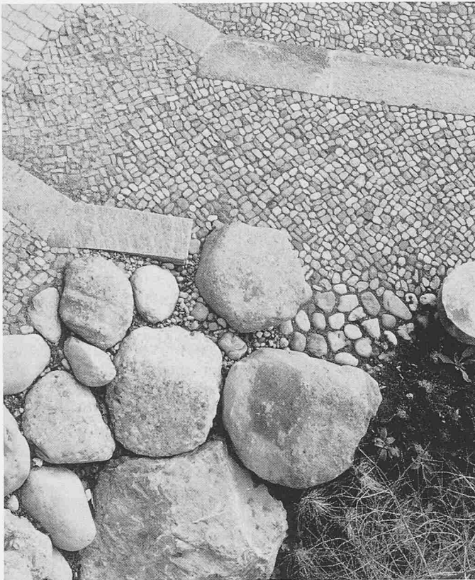
Kantonsschule Rämibühl, Zürich. Das Ornament natürlicher Materialien