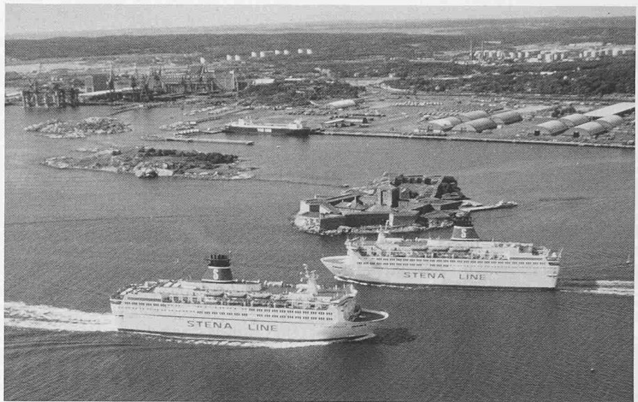
Die beiden dänischen Fähren Stena Danica und Stena Jutlandica für Passagiere und Autos. Beide werden von Viertakt-Diesel-Motoren 12 ZV40 von Sulzer mit 25 590 kW (34 800 bhp) Gesamtleistung angetrieben

Das bei der Behandlung von Klärschlamm anfallende Biogas könne in kleinen Blockheizkraftwerken zur Strom- und Wärmergewinnung genutzt werden. Diese Möglichkeit werde bislang vor allem von grossen Kläranlagen noch viel zu wenig genutzt. Durch diese Technik, so rechnen die Bochumer Wissenschaftler vor, würden der gesamte Wärmebedarf und etwa die Hälfte des Stromverbrauchs der Kläranlagen