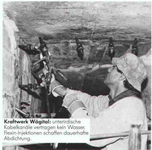
Kraftwerk Wägital: unterirdische Kabelkanäle vertragen kein Wasser. Flexin-Injektionen schaffen dauerhafte Abdichtung.

Für das Abdichten von Rissen, Fugen und undichten Stellen an neuen und alten Betonbauten sind Renesco-Flexin-Injektionen die sicherste Methode, unter allen Umständen. Flächenabdichtungen nach dem Renesco-Vandex-System schaffen trockene Untergeschosse, selbst wenn das Haus im Grundwasser steht. Die Renesco-Spezialisten arbeiten mit eigenen