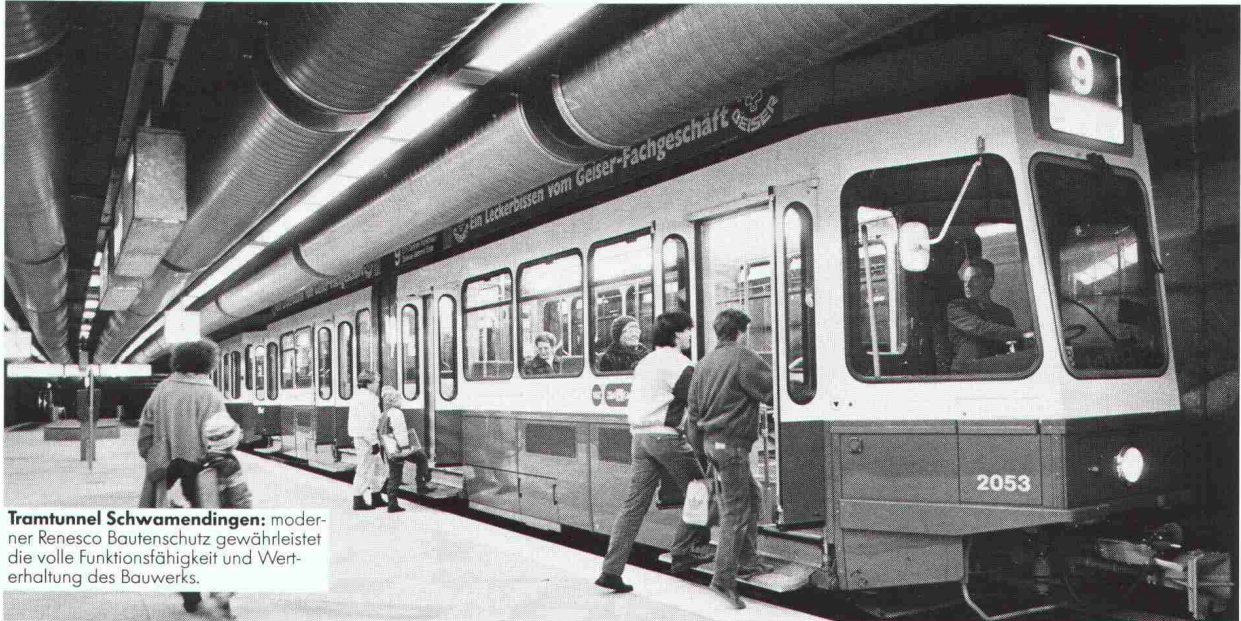
Tramtunnel Schwamendingen: moderner Renesco Bautenschutz gewährleistet die volle Funktionsfähigkeit und Werterhaltung des Bauwerks.