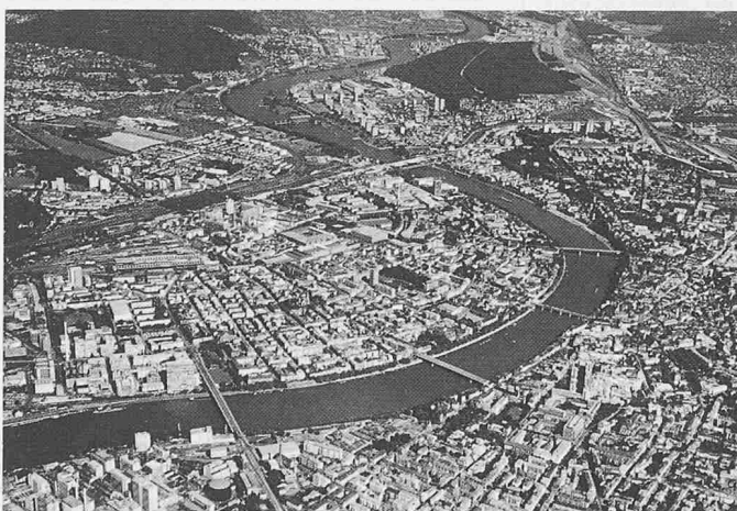
Grosse Städte (im Bild Basel) sowie Bergkurorte mussten im Sommer 1987 Frequenzeinbussen hinnehmen

(fwt) Weltweit werden in Wissenschaft und Technik jährlich mehr als zwei Millionen Beiträge in über 100 000 Fachzeitschriften und Fachbüchern publiziert. Hinzu kommt eine etwa gleich grosse Zahl von Forschungsberichten, Patenten und Normen. Das sind rund 20 000 Fachveröffentlichungen pro Ar-