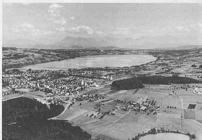
Einen vermehrten Zustrom an Touristen verzeichneten dagegen Seazonen und vor allem die Zentralschweiz