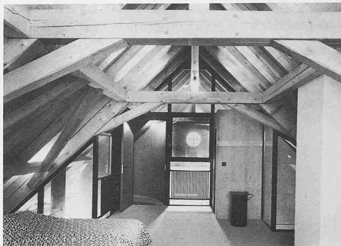
Diese zu neuem Leben zu erwecken, ist eine reizvolle Aufgabe für jeden Gestalter